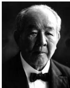
渋沢栄一 Eiichi Shibusawa

理念 Principle // 順理則裕 じゅんりそくゆう なすべきことをなし、ゆたかにする Adhering to reason leads to prosperity Jun-Ri-Soku-Yu めざす姿 Vision // 私たちは、素材+サイエンスで人と地球に求められるソリューションを創造し続けるグループになります We will continue to create the solutions needed by people and the earth with our materials and science 大切にすること Values // 私たちは、変化を恐れず、変化を楽しみ、変化をつくります Welcome change. Enjoy change. Create change.